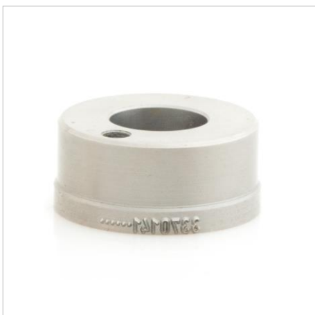
Prägerollen / Prägerollenhalter