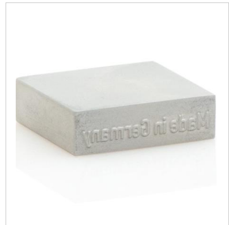
Gravurtypen / Blockstempel