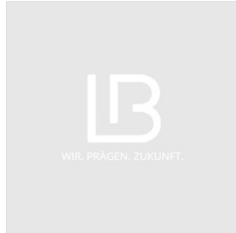
Touch-Display TC 100