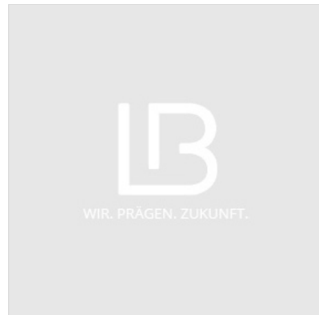
Höhenverstellung mit Anbausatz